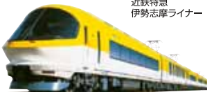
近鉄特急 伊勢志摩ライナー